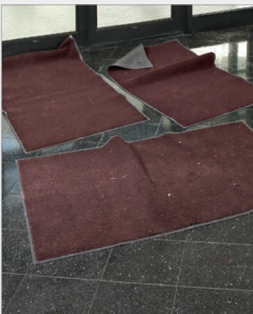
Verschiebungen und Verrutschen.