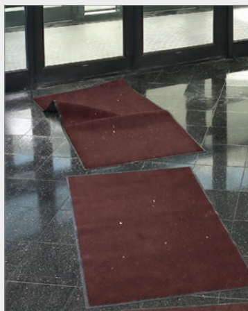
Lücken und Falten.